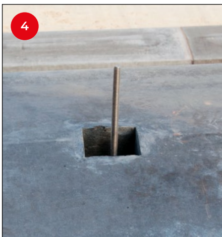
4 Positioneren en het op zijn plaats laten zakken van de afdekbands worden zo heel eenvoudig (de derde-handjes blijven gewoon zitten).