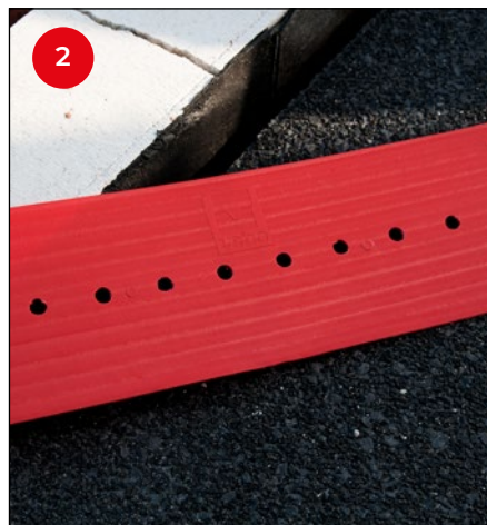
2 Pak een derde-handje en kies het gat dat zich voor de gegeven spouwsituatie het best leent. In de praktijk zal dit vaak een van de gaten in het midden zijn.