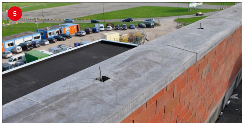
5 Door van tevoren alle draadeinden van derde-handjes te voorzien, kan het plaatsen van de afdekbands als een routinematig - en dus kostenbesparend - proces worden uitgevoerd.